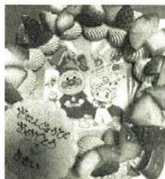
甥は未だアンパンマン