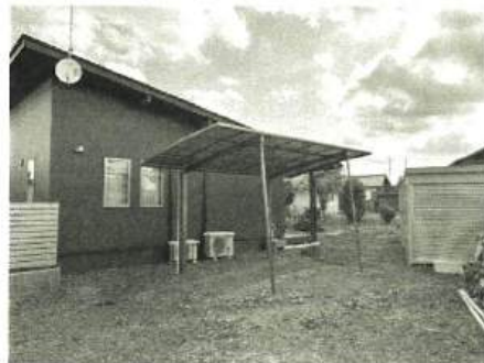
1台用も設置。夏は車内の暑さを軽減し冬はガラスの凍結を防ぐ優れもの