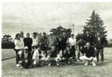
年々増える参加者！今回は5組