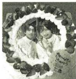
姪の推しは「あらがちゃ」