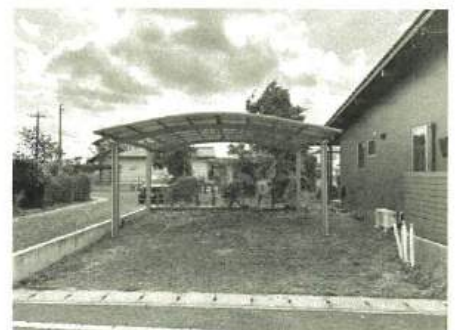
奥に建つ母屋との動線も良いこちらは2台用