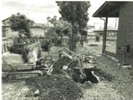
柱を設置するため頑丈な土台を埋めます