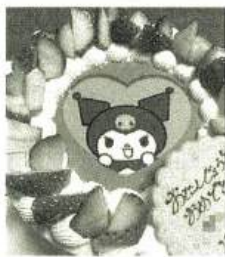
クロミちゃん可愛い