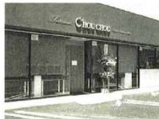
「パティスリーCHOU CHOU (シュシュ)」 足利市朝倉町257

ご紹介するのは、「パティスリー シュシュ本店(足利店)」です。毎回、ホールの誕生日ケーキを予約して、買ってあります。姪っ子のは、生クリームでイチゴをサンド、甥っ子のは、チョコレートケーキでバナナをサンドしてもらってます。どちらも、とっても美味しいのですが、我が家ではチョコレート派が多いですね。真ん中のチョコレートの部分には推しメンや好きなキャラクターを印刷してもらいます。いつもキレイな仕上がりに感動です。営業は11時から。次は私の誕生日ですが、たぶんケーキは・・・ですね。