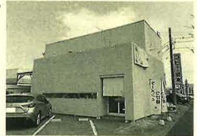
「杏と桜」太田市浜町43-5