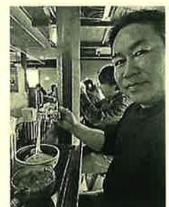
Bin0本部の方や他の加盟店さんとの交流も大切 お昼はご当地ラーメン