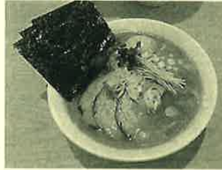
ドロドロ濃厚味噌で大好物認定!