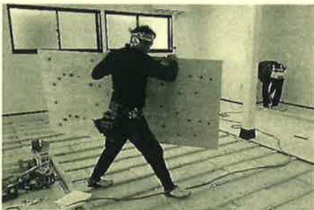
コンクリートだった床に断熱材を入れて無垢の床に改装しました