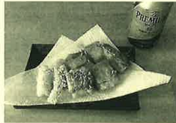
釣った魚での一杯は最高です！