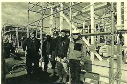
いつものメンバーで手際が良い！