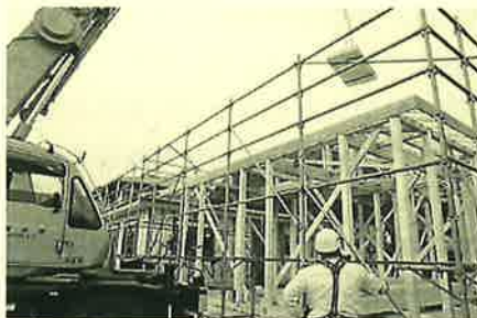
暮らしやすい平屋3棟の貸家です