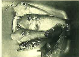
今年も沢山釣れるといいなあ♪