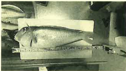
体長40cmオーバーの甘鯛