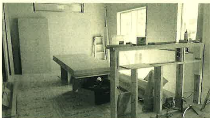
工事中しか見られない光景も、お家づくりの楽しみです！