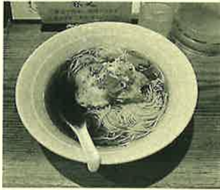
まずは醤油ラーメンに挑戦