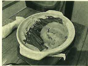
大工さんは冬季限定みそラーメン