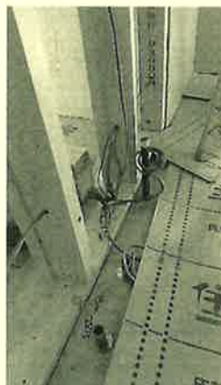
壁が出来ると、これらの配線は見えなくなります