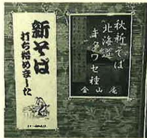
「新そば」に誘われて