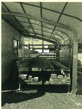
在庫を処分して ラックも直しました