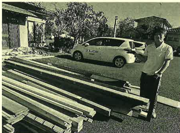
来年は在庫が出ない様に努力しますが もし処分する時はお譲りしませう(汗)