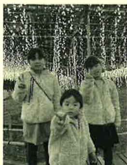
今年も一緒に行こうね

久しぶりに行って来ました。あしががフラワーパークのイルミネーション。前回、行った時よりバージョンアップしていて、すごく綺麗でステキでした。私のお気に入り「フラワーキャッスル」お城があり、それに登ることができます。光の花火が上がると「わあー」て声が出てしまいます。600畳の大藤もすごいのですが、プロジェクションマッピングが演出する「日本の四季」もお見事でした。足利の誇れる観光地ですので、ぜひ一度、行ってみてくださいね。今回はじめて3歳の甥っ子を連れて行ったのですが、、、走ってしまうので大変。でも、喜んでくれていたので、うれしい伯母バカです。帰りに買うのは、子供が大好き、「光るアメ」です。