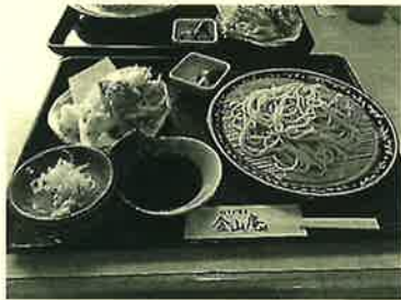
天ぷらがサクサクで美味しい！