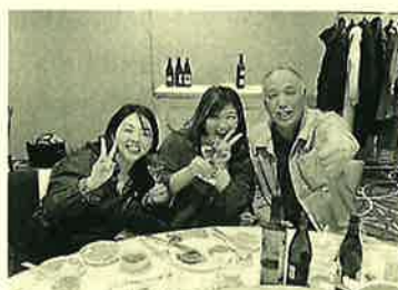
Bin0本部の方とも仲良し♪