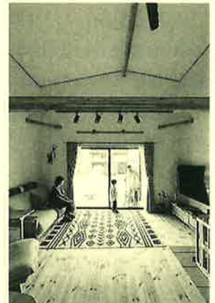
吹抜けで開放的なリビング

奥：うちの家族には狭すぎず広すぎず、家事もしやすくてちょうどいい広さです。一度暖めたり冷やしたりすると、それを保てるんですね。真冬に全然寒くなかったのは驚きました。主人なんか、布団をかけないで寝てたくらいです（笑）