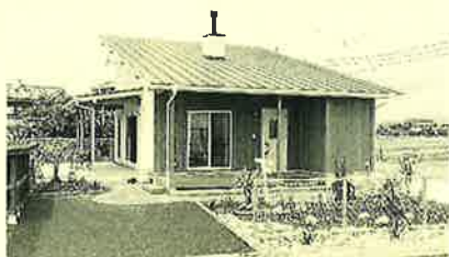
皆さんもお気軽に遊びに来てくださいね