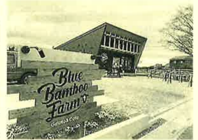
牧場に隣接するカフェ 自然な甘さで美味しい