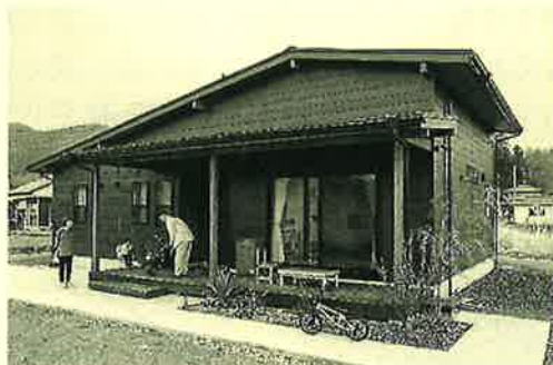
お友達が集まってBBQをする休日が楽しみ