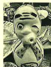
好きなものを選ぶって嬉しい お料理も美味しいです♡ 河童の口が注ぎ口 注ぐと小鳥の鳴き声が♪ ひよっとこ