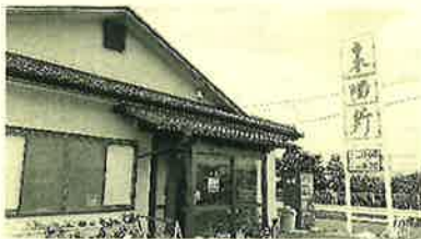
「来陽軒」足利市堀込町1605-4