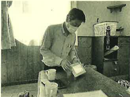
モニターの使用方法を説明中