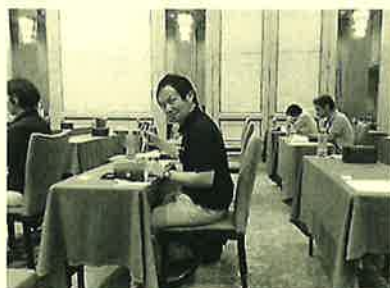
社長と私の2人で行ってきました