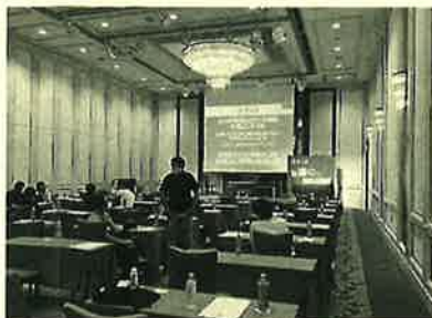
弊社は大宮のパレスホテルで参加