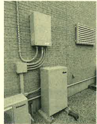
外部にパワコンと7kw分の蓄電池