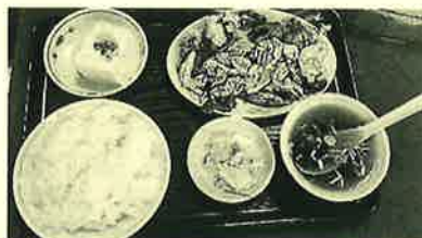
お店オススメの 「ホイコーロー定食」