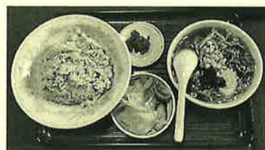
山ちゃん美味しかったかな? 結構ボリュームあります!