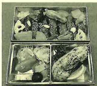
豪華な昼食を頂いて♪