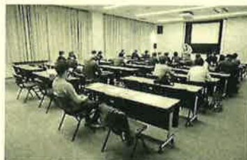
沢山の業者さんが参加されました