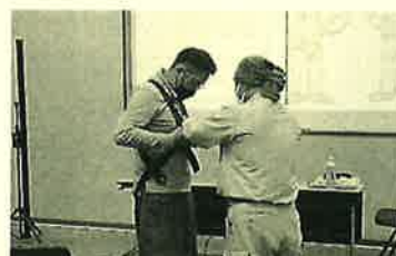
きちんと装着できているかチェック！