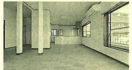
抜けない柱はあるものの、広々と快適な リビングに生まれ変わりました