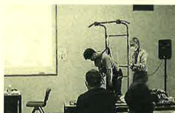
サダちゃん宙づりの図