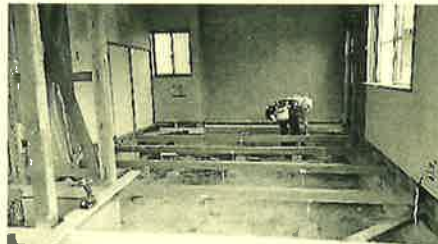
大工さんが入って床から新しく この機会に安全性も高めます