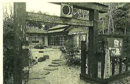
「庭cuisine 照蔵(てるぞう)」 太田市高林南町852