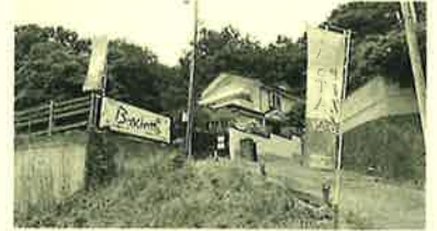
「Boschetto(ボスケット)」 太田市金山町38-42

外出を控えるということで我が家でもテイクアウトメニューでお家パーティーをしました！今回ご紹介するのは太田市の金山にある「Boschetto」(ボスケット)です。フットサルを一緒にやっているメンバーの弟さんがオーナーシェフをしているので、メンバーでの新年会を行ったりとお世話になっております。今回の自肅からテイクアウトメニューを始めたそうです！ピザもパスタもお肉や魚料理も言うことなしで美味しいです！特にお勧めは生ハムの盛合せです。数種類の生ハムが入ってますが全て美味しく、食べ比べる度に至福の時間を味わえること間違いなしです！冷めても美味しいので、是非ご賞味ください！