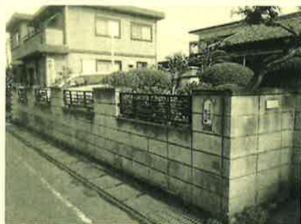
40年間お疲れさまでした