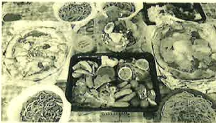
まるでお店にいるかのような気分♡