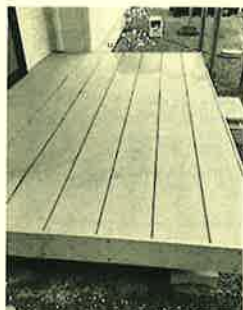
新設のウッドデッキ