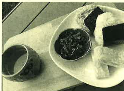
おにぎりもご馳走になります♪