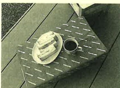
コーヒーとサンドイッチでカフェ気分