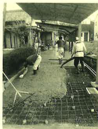
コンクリート打設。皆さんありがとうございます