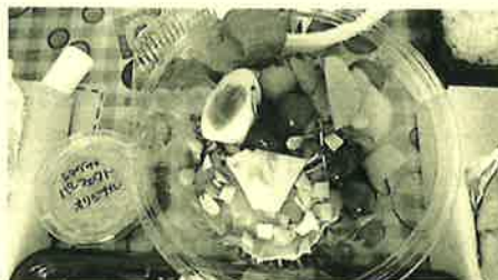
生ハムの盛り合わせがお勧めです!!