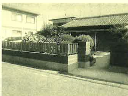
これで安心です。見守り隊は続きます