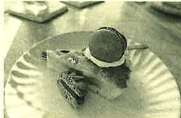
テラス席で食べるケーキは格別♡