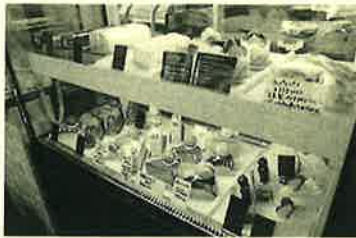
目にも美味しいショーケース