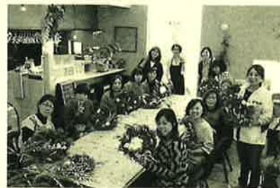
「花カフェシフォン」 太田市小舞木町428-1

11月8日にクリスマスリースづくり講習会を太田市小舞木町にある「花カフェシフォン」さんにご協力頂きコラボイベントとして開催いたしました。おしゃれでステキなお店をお借りして、オーナー先生にクリスマスリースの作り方を丁寧に教えて頂きました。リースの土台にヒムロスギ・ユーカリの枝などを切ってワイヤーで巻き付けていきます。細かく切って3枚ぐらいを重ねて、付けるのが綺麗にできるコツのようです。皆さん、真剣に黙々と進めていきますので、手を動かすのに一生懸命。「パキパキ」と枝を切る音だけが響いており、楽しくないのかな？と先生が心配してしまうほど、作業に没頭しておりました。とっても楽しそうでしたよ。巻き終わったら、最後はリボンや松ぼっくりなどを好きな所に取り付けて完成です。世界にひとつだけのクリスマスリースが出来ました。「花カフェシフォン」さんはランチとシフォンケーキも美味しいお店なので、それも楽しんできました。ごちそうさまでした。楽しいお時間をありがとうございました。