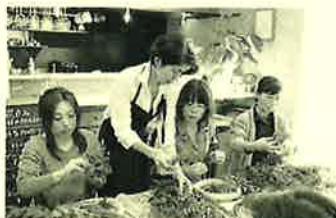
花カフェシフォンさんとのコラボイベント