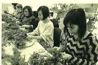
初めての方も上手に出来ました