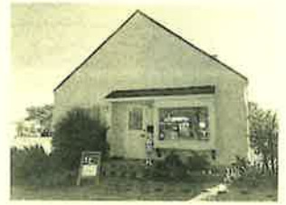
「ROPON(ロポン)」 邑楽郡板倉町朝日野3-8-8

タカマユです。今回ご紹介するのは、板倉東洋大駅前通りにある、可愛らしい建物のCafe ROPON(ロポン)さんです。自家製のケーキやマカロン、焼き菓子の販売もしているCafeなんですけど、お店の外観も店内もすごく可愛らしい作りになっていて足を踏み入れた途端に「可愛い♡」と思わず声が出てしまうような感じ。ショーケースにあるケーキをそのまま買って帰ることも出きますがカフェでランチも食べられるみたいです。今回私たちはお茶とケーキのセットにしました。女性パティシエのオーナーさんが作る美味しいケーキ♪色々あって目移りしちゃいました。すごくおいしかった！今度はランチで行ってみたいと思います(*^^*)