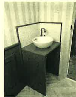
トイレの手洗いにはお気に入りのタイルを採用