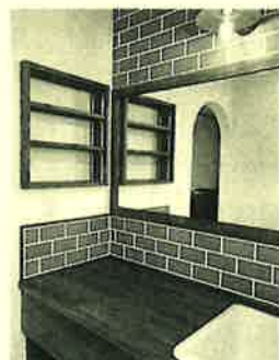
洗面所は大きな鏡で2人同時でも安心