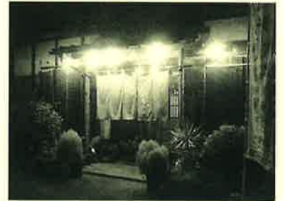
「たつの家」 邑楽郡大泉町坂田7-10-12

今回、ご紹介するのは大泉町坂田の和食処「たつの家」さんです。私が行くのは決まっています。いつも夜ですが、...。ゆっくりお食事やお酒を飲む方はお座敷で、テレビを見たりお店の方とおしゃべりしたい方はカウンター席がオススメ。常連さんで賑わっているお店です。たつの家さんに行って私が必ず頼むのは、メサバ、もずく酢とイカ焼きに梅酒サワー。美味しいですよ。メサバに惚れて通うようになったので。まだランチでおじゃました事はないですが、お刺身・とんかつ・しょうが焼き定食などがあります。すべて¥680円。ランチは2時までですよ。私はソースかつ重が食べたーいなあ。落ち着いた雰囲気のお店なので是非、行ってみてくださいね。