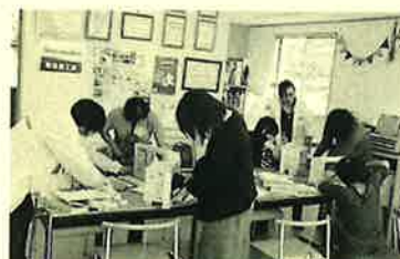
スタッフがサポートしながら