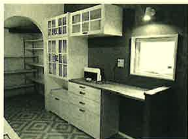
奥様の要望でキッチン奥にはパントリーを