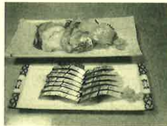
刺身盛り合わせ(梅)+メサバ