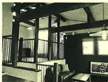
ダイエット効果もあるスキップフロア(笑)