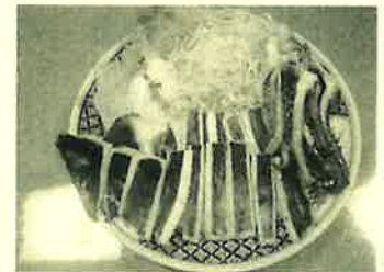
柔らかくて美味しいイカ焼き