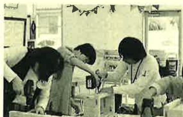
初めてドライバーを持つ人も