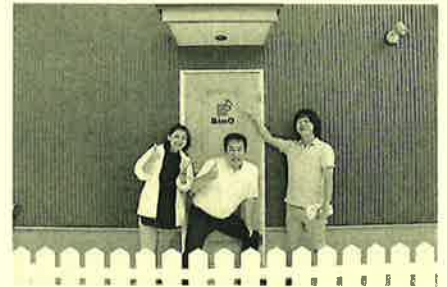
BinO大好きG様 オリジナルステッカー 私達も嬉しいです!!