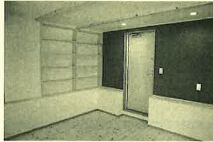
造作で本棚をお作りしました サイズも入れたいものに合わせられます