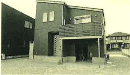
人気の外壁色「モスグリーン」で カッコよく♪