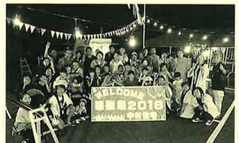
今年もOBの皆さんと楽しい時間が過ごせました!!

タカマユです。中村住宅では毎年7月に夏祭りを開催していましたが、今年は暑い真夏を避け、9月にお客様感謝祭を開催しました。9月になり、やっと少し爽やかさを感じられるようになった9月14日、たくさんのお客様と共に楽しい感謝祭イベントを行うことが出来ました。今回は設営も変えて、ちょっとおしゃれにイメージチェンジ！いつものケータリングカーに加え洋服販売や風船アートの催しなどもあって、いつものお祭りとは一味違うイベントです。これからも、皆様とともに楽しめるイベントを企画していきますので、今年参加できなかった方も次回是非ご参加くださいね(*^^*)