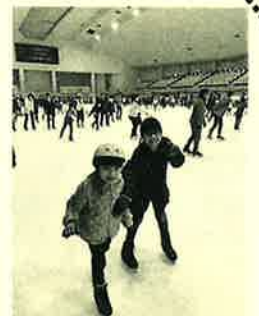
神奈川県「銀河アリーナ」

今回は出かけたついでに県外のスケート場に行ったのですが、プロも来る様な大きなイベントが開催される由緒あるリンクだったようです。前回、まだ年少だった三女も今は一年生。ほぼ初体験なのに、途中から一人でスイスイ滑れるようになってしまったので、子供って本当にすごいですよね(^_-)☆ 私も「昔取った何とか」でまだ滑れたので名誉は守れましたっ!! 楽しかったので、また行きたいです。