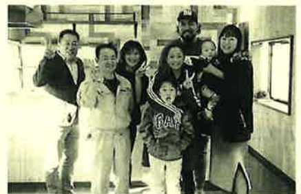
ワクワク度UPのH様邸♪