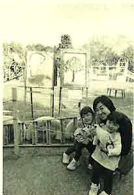
ぞうさんが描いた絵と 姪と私

11月は姪の5歳の誕生日、なぜか2歳の姪にもプレゼントを買い、12月はクリスマス、1月はお年玉と伯母ばかは今も継続中です。5歳になった姪が「ぞうさんに乗りたい」と言うので、千葉県にある「市原ぞうの国」に行って来ました。12頭のぞうがおり、楽しみはぞうさんのショーです。鼻を器用に使い絵を描いたり、サッカーやダンスをします。ぞうさんは営業上手でもあります。ショーの中でぬいぐるみを買えるのですが、ぞうさんが鼻でつかみ渡してくれるのです。これは欲しくなっちゃいますよね。案の定ふたつお買い上げ。ぞうさん好きにはおススメですよ。1月には赤ちゃんぞうも生まれました。触れ合えた事に満足しぞうさんには乗りませんでした。