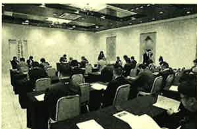
現場の安全は工事の基本です