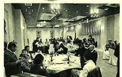
盛り上がる恒例のビンゴ大会♪