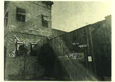
「青の洞窟」 足利市岩井町791-2

タカマユです。今回ご紹介するレストランは、足利にあるDining Bar「青の洞窟」というイタリアン料理のお店です。お店の外観も、石造り風がイタリアンチックでとってもおしゃれ。ここはいつも混んでいて、ランチで行ったのですが今回はギリギリセーフで入れました。ランチメニューはA、B、Cセットがあり、それぞれの組み合わせを選ぶというもの。私たちはデザート付きのBセットをチョイスしました。メインのお料理とデザート、飲み物は選ぶことが出来、サラダとスープは付いてくるというセットです。結構ボリュームでお値段税込み1,382円。私はメインを豚キムチ石焼ビビンバに。これ、イタリアンじゃないんだ？(^^;)もちろんパスタやハンバーグも選べます。アツアツの石焼の器で、最後まであったかいまま食べられます。お料理がおいしいのはもちろんだけど、お店の雰囲気がいいって女子にはうれしいポイントですよ。夜はおいしそうアラカルトとワインやお酒が飲めるみたいです。個室になって楽しい仲間でワイワイ行くのもいいみたい！あなたは誰と行く？♪