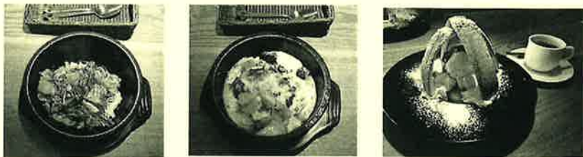
豚キムチ石焼ビビンバ ハンバーグドリア デザートがボリューム満点