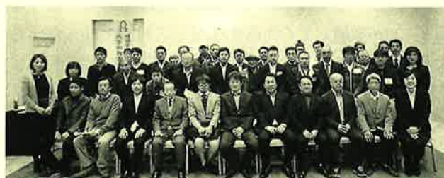
今回も中村住宅自慢の「匠」たちが気持ちを一つにしました