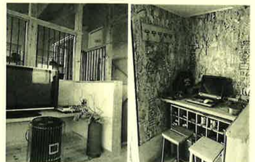
ご夫婦でこだわって揃えているインテリア