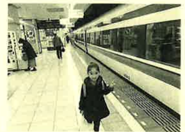
無料で乗車するのも今回が最後