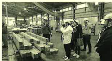
新工場見学ツアーに参加♪