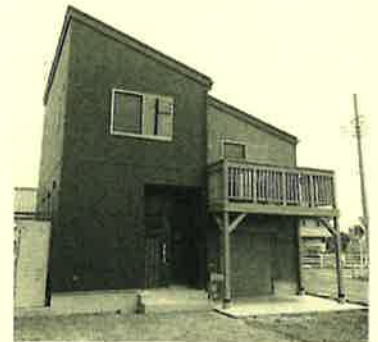
スキップフロアのWAVE

主:建物のトータルバランスを考えたりね。家づくりは1人では出来ないから、相手を尊重したり、思いやりなども必要な。自分が満足出来る家を建てて下さい。