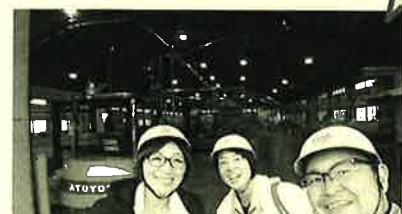
スタッフ3人で行ってきました