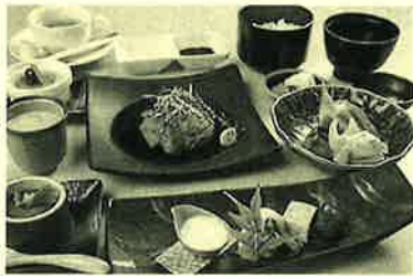
ちょっと贅沢な漣コース2,000円