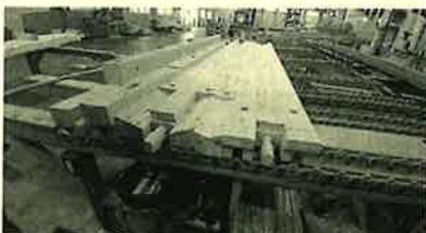
頭の良い機械にビックリです!