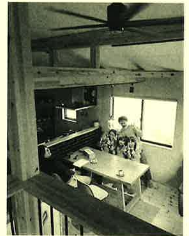
いつも楽しいK様ファミリー