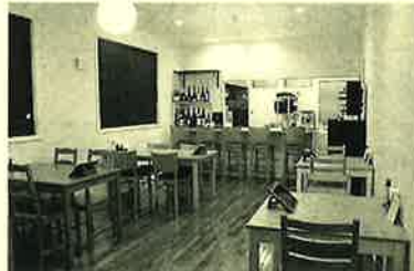
15名から貸切も出来るそうです