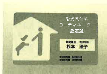
猛勉強して資格取りました♪