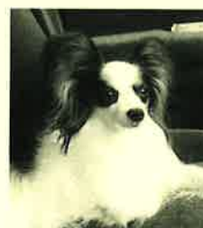
わが家のアイドル「ソラ」です