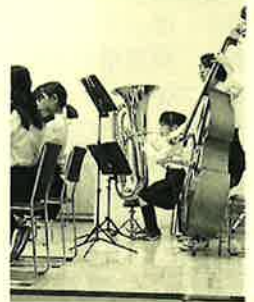
長女 文化祭でのチューバ演奏