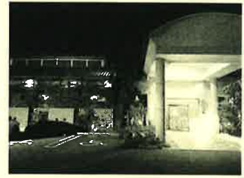
「旬菜茶房みかわ 熊谷店」 熊谷市小島708-1