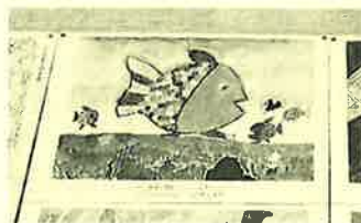
入選した次女の絵「にじいろのさかな」

子供達のおかげで、忙しくも楽しい秋を過ごせました(^_^)/ たまには自分で何かをしな ちゃ、ですかね♡