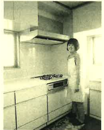
使いやすくなったキッチン

O様、リフォーム前の片づけや約一週間キッチンが使えず、ご不便で大変だったと思いますが、これから快適にご使用して頂ける事を嬉しく思っております。ありがとうございました。今後とも、よろしくお願い致します。