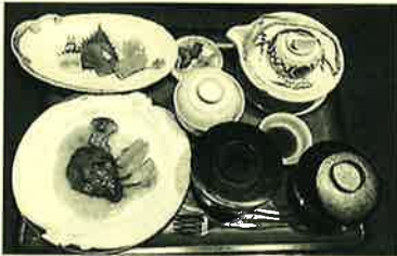
ちょっと贅沢に「みかわ御膳」を注文