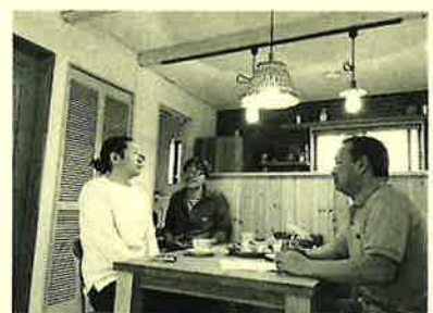
カフェの様なりリビングでまったり