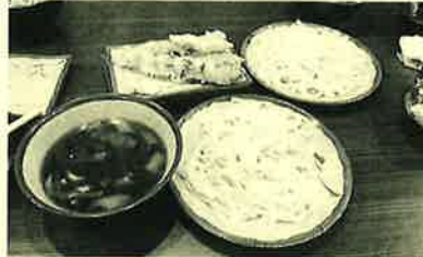
麺の量が増えても金額同じ!!