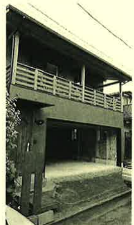
2階リビングの深谷市T様邸