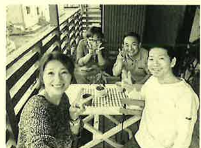
バルコニーでお茶なんて素敵♪