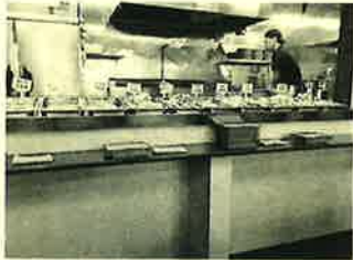
カウンターに並ぶ食べ放題の天ぷら