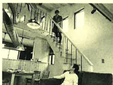
ストリップ階段でお部屋を広く見せて