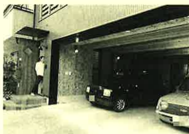
シャッター付きのご自慢のガレージ