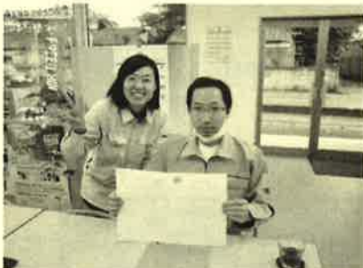
ご契約。お世話になります。「上棟すると大きいですね。楽しみです」と〇様