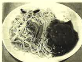
魅惑のナポ・バーグ デミグラスハンバーグセット 次の週のペペ・バーグ