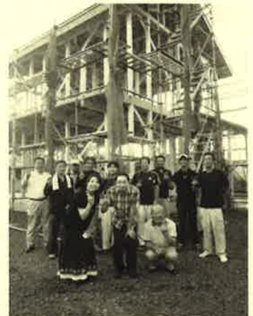
笑顔の記念撮影。ピース！