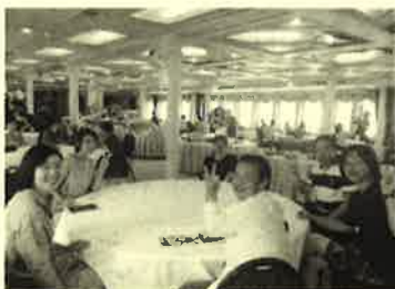
たまにはランチクルーズもいいね