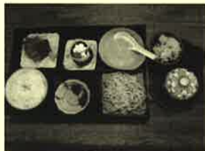
ヘルシー とろろ御膳980円