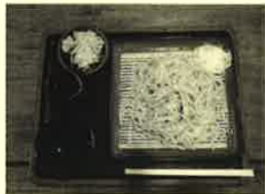
さっぱり 大根そば580円