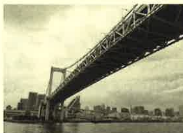
レインボーブリッジを下から眺めて