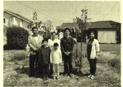
邑楽郡千代田町 F様