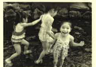
沢遊びに大はしゃぎ♪