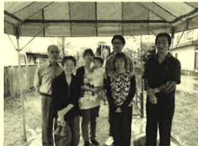
佐野市犬伏中町 H様