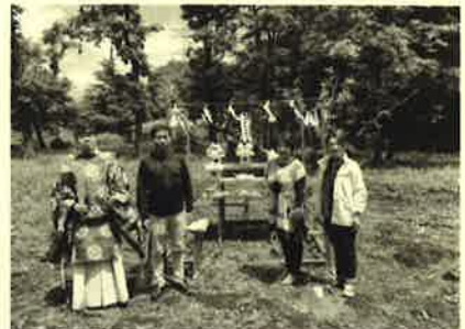
みどり市大間々町 A様